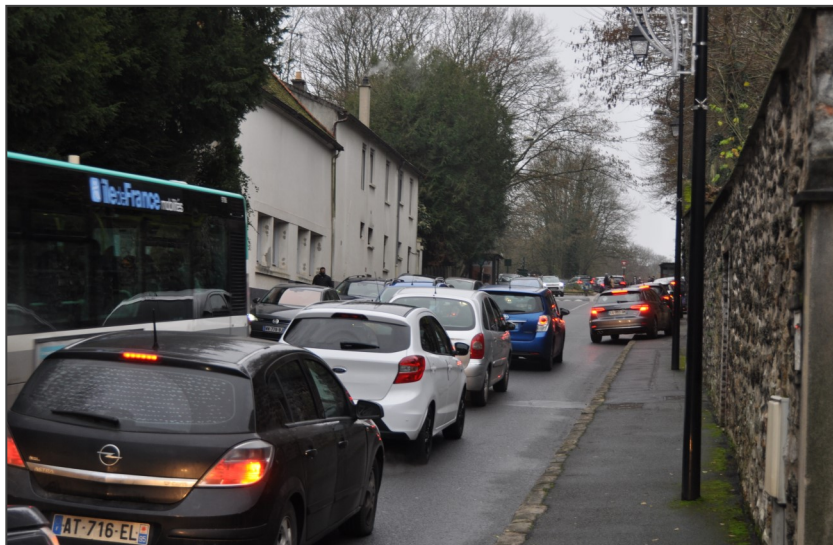
Embouteillage rue de Paris/entrée sud d'Ecoeu : étudier la possibilité d'un accès à la RD316 vers le nord.

Pas question non plus de modifier la topographie de notre ville : le nombre d'entrées et sorties de la ville est immuable et la forêt ne sera jamais percée d'un tunnel ! Pire, dans les villes voisines, le nombre d'habitants augmente et leurs projets immobiliers ne sont que rarement soumis à notre aval.